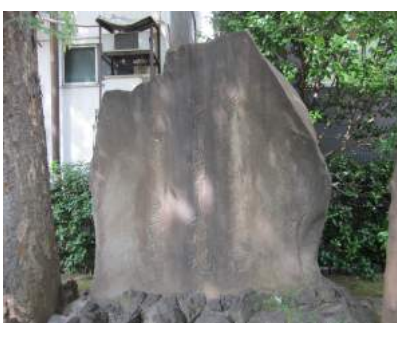
「身はたとひ 武蔵野辺に朽ちぬとも 留め置かまし 大和魂」(十思公園内) 日比谷線小伝馬町駅すぐ

だが数年後に安政の大獄にて、ふたたびこの小伝馬町の牢に入獄することになる。1869年、クレイジーな男は30歳の若さで、この世を去ることになる。