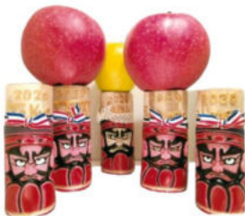
応援します、 りんごのふるさと TOKYO オリンピック。

会場：中央区日本橋本町4-5-12本銀第一ビル3階トリーポリマー(株)会議室、並び協働ステーション中央(中央区日本橋小伝馬町5-1十思スクエア2階) お問合せお申込：トリーポリマー(株)内、トリーポリマー(Neshian)ねしあん ・長内(おさない) 電話：080-3453-4556 mail: osanai@toho-polymer.co.jp 名前、電話番号をご記載ください。