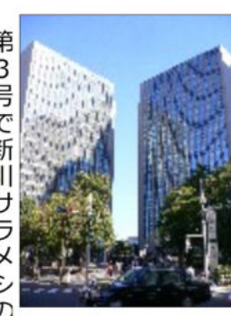
新川住友ツインビル、隣にはダイヤビルも

オフィス街の多い中央区ですが、佃・月島はあまり企業が多くないようです。中央大橋を渡った新川には大きなビジネスビルもあり、ランチ時にはたくさんサラリーマン達が街に出てきます。そんな新川で働く人々は毎日どんなランチを食べているのでしょうか? きつと安くて美味しいお店がたくさんあるはず。私たちがちよつと足を延ばして食へに行きたいですね。