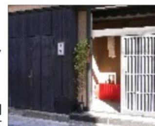
福島屋 03-3551-8539 中央区湊1-3-3

やっぱ一番は「生」でしょ! 高級料亭みたいな和風で重厚な建物と大正ロマンの内装だけで圧倒されてしまいます。ランチタイム限定のハンバーグ200g1,080円は大人気。鉄板で自分で焼きます。問題は11時半に開店なのですが同時に満員となることです。ですから若手社員に11時から並ばせては後から。もちろん若手にはごちそうすることになります。ぜひ11時には並んでください。 新川1-9-8 電話031335518980