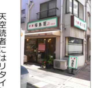
福島屋 03-3551-8539 中央区湊1-3-3