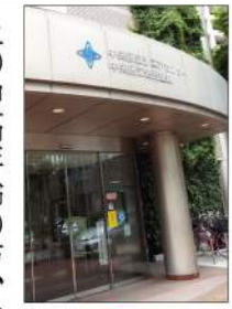
佃小学校隣の「シニアセンター」の利用には50歳以上の方対象です。

上の中高年齢の方、講座・サークルなどの登録団体が対象です。週刊誌や新聞とゆったりしたソファがあり寛げますね。パソコンも数多く設置されています。また「中央区生きがい活動支援室」も開設しています。