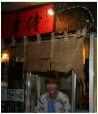
▲月島駅6番出口からすぐ。赤提灯の一際目立つ築80年の長屋