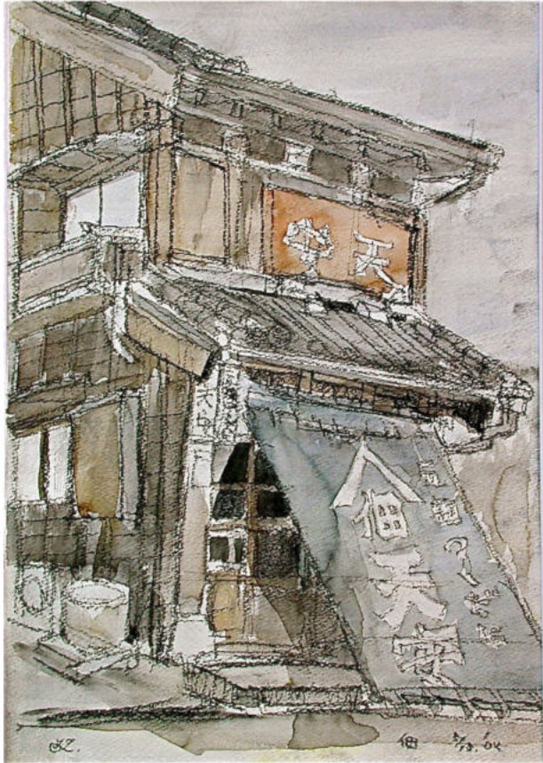
▲佃の歴史に佃天安あり！ 画用紙・水彩

私は下町育ちのせいか、佃島に行くとき、古き良き東京の面影が残っており、開閉していた頃の勝鬃橋や月島のもんじゃ焼きが懐かし