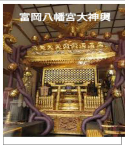
富岡八幡宮大神輿

まずは隣駅門前仲町に モンナカ交差点からちよつと両国より入った路地に辰巳新道があります。江戸城から見て辰巳の角にあつた深川は料亭がたくさんあり、今では居酒屋の宝庫でもあります。小さな屋台のような店が集まつた辰巳新道はカラオケ画像やテレビ居酒屋番組のタイトルバックにも使われる情緒ある横丁です。昭和の香りが今でも残っている店にはお決まりのママと常連さんでいつも賑わっています。初めてではちよつと勇気がいるかも知れませんが、飛び込んでしまえばもうすっかり下町気分です。