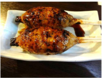
一番人気!! 20分間じっくり焼き上げるつくね250円

飲み物は生ビール四三〇円、ハイボール四八〇円と、とてもお財布に優しいのです。焼鳥は、築地のお店から毎日届く上質の鶏肉を使用しているそうです。白レバー一〇〇円、岩塩で味付けした焼鳥一八〇円、とり丼八〇〇円、その他・・・。