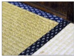
▲店内に敷かれた畳のいい香りがします。