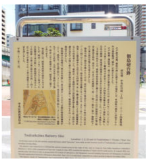
Tsukudajima Battery Site

嘉永6年(1853)浦賀沖にアメリカ合衆国のマシュー・ペリー提督率いる軍艦4隻が突然姿を現しました。幕府は江戸湾海防強化の必要性を痛感し、6つのお台場建築を翌年には完成させました。