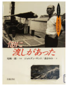
中央区立京橋図書館所蔵

(レジュアルブック水辺の生活誌) ジョルダン・サンド/森まゆみ文 尾崎一郎写真 岩波書店 昭和39(1964)年に開通した他大橋とともに姿を消した「他渡」。