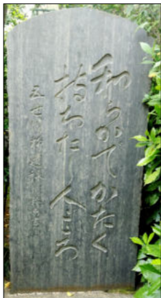
江戸他島の漁師に養われ、魚問屋を開き名主となり、他島に尽くしたとされています。

町歩きをしていると、いろいろな石碑や史跡、説明板を見つかることが多いです。他・月島でそんな街角の記録を探してききました。