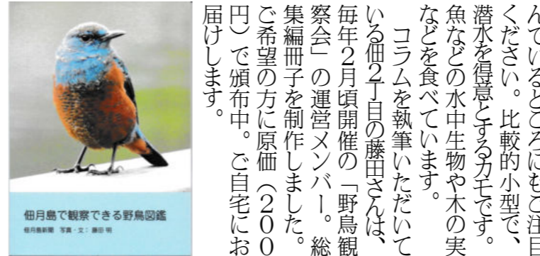
佃月島で観察できる野鳥図鑑