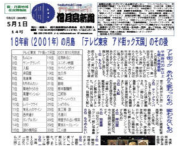
18年前(2001年)の月島「テレビ東京 7夜連続天國のその後」

「1月に月島に越してきました新参者です。この街が好きで念願かなって住むことになり、ポストに入っていた佃月島新聞も興味深く読んでいます。今までは、島新聞も興味深く読んでいます。今までは、島新聞も興味深く読んでいます。」