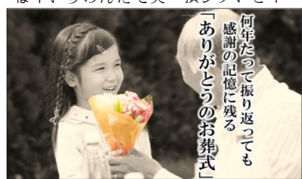
何年たっても振り返っても感謝の記憶に残る「ありがとうのお葬式」