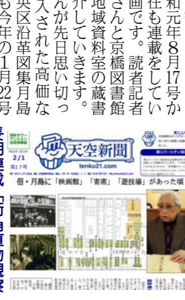
佃・月島に「映画館」「寄席」「遊技場」があった頃

16号相牛橋から始まったこの連載ですが、22号のわたし公園で終了しました。やはり住吉神社がこの宝庫でした。天空新聞 平成28年2月17号 佃・月島に映画館 寄席 遊技場があった頃