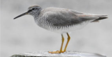
5月頃と8月頃に日本に立ち寄ります。春、日本で羽を休めて夏には北へ旅立って繁殖。8月ごろにまた立ち寄って越冬地へ向かう旅鳥です。

日本は、単なる経由地。ちよっと羽休めしているだけなので、この出会いは貴重です。石川島公園などでは、岩場が見えるとき、潮位が低いときに多く訪れます。潮位30センチ以下のときを調べて観察すると、出会える可能性が高まります。このコラムの執筆は佃2丁目藤田さんの。毎年2月頃開催の「野鳥観察会」の運営メンバー。冬夏図鑑の在庫があります。ご希望の方は編集部まで。