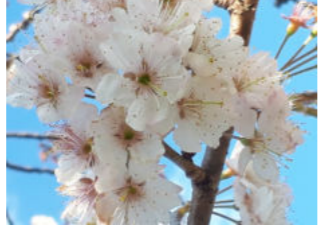
に公園に樹や街路樹は病害虫駆除のため薬剤散布している

五月になると木々は実を着け始めます。サクらの葉陰に赤や黒の小さな実や、果汁タツプリなピロ、ヤマモモ等。熟したもの