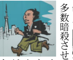
所傍に命じて開国論者たちを、多数暗殺させたことは有名です。ね。幕末を語るには切っても切り離せない場