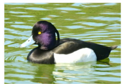
佃月島で観察できる野鳥

図鑑連載33 「キンクロハジロ」 目が金色、羽が黒、そしてハジロ属なので、キンクロハジロ。ハジロ属の名前の由来は、羽を広げたときに白い帯模様がでるところから。スズガモやホシハジロもこの仲間、冬鳥です。オスメスともに寝癖のような冠羽があるのが大きな特徴。オスの頭は、光の状況により、紫色に輝きます。潜水が得意で、水底の貝などが好物。メスのキンクロハジロは、スズガモと区別が難しいので、オスで判断してください。 この連載コラムは佃二丁目藤田さんの執筆です。左の野鳥図鑑を無料で進呈します。申込は編集部まで。