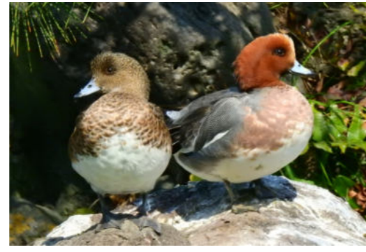
佃月島で観察できる野鳥 図鑑 連載36 「ヒドリガモ」

冬鳥。オスは、頭がモヒカンカットのよう、茶色とクリーム色に色分けされていて、クチバシは灰色で先だけ黒。漢字で書くと、緋鳥鴨です。 オスの頭が緋色に見えたところから名付けられたようです。藻や葉っぱが好き。人がいないとき、陸に上がって草を食べていることもあります。 このコラムは佃二丁目藤田さん執筆です。「冬の鳥図鑑」を差し上げます。編集部までどうぞ。