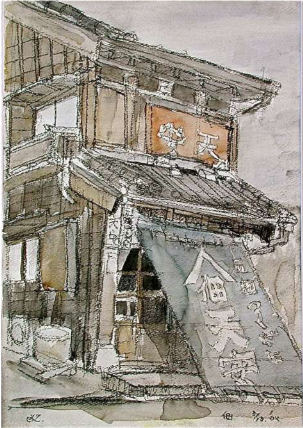
▲佃の歴史に佃天安あり！ 画用紙・水彩

のを観ると、ホッとした気持ちになり、昔は佃の渡してこの街に入ったのを懐かしく思い出します。現在では高層ビルに囲まれた風景ですが、絵は便利なもので、その中から、古いもののみ抽出して描くことが出来ます。そんな風情を楽しみながら、また描きに行きたくなるところが「佃・月島」です。