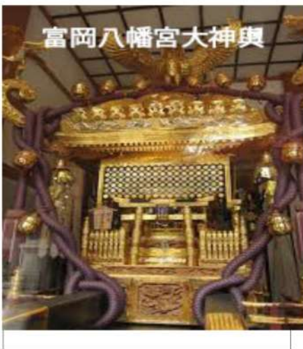
富岡八幡宮大神輿

お店への目移りもまた楽しく、名物の下町グルメ、深川めしで腹も満たされたら、八幡宮とお不動さんへお参りに。毎月1日、15日、28日の縁日の日ならわくわくも一入です。