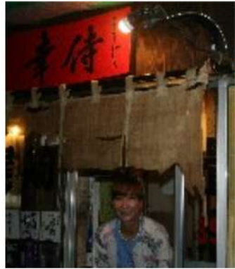
▲月島駅6番出口からすぐ。赤提灯の一際目立つ築80年の長屋