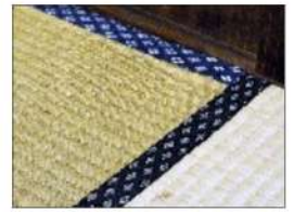
▲店内に敷かれた畳のいい香りがします。