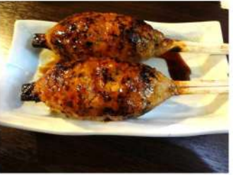
一番人気！！20分間じっくり焼き上げるつくね250円

お酒も日本酒からビールにサワーと種類豊富。更にとつても安い。これではなかなか帰れません。(笑)気さくな店主と美味しいお酒や焼鳥、そしてお店の雰囲気最高に居心地良く楽しいひと時が過ごせました。