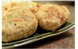
▲いなりコロッケはサクふわでしたよ♪