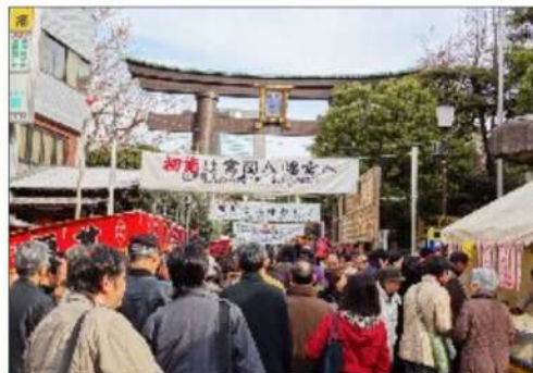
富岡八幡宮初詣の賑わい

『うちは商売繁盛祈願で毎年小網神社だね(新川在住)』、『元旦は混むので5日の初水天宮に行きます(月島在住)』など、ご家族によって行き先、目的も異なります。『佃波除稲荷って知ってる？区的重要文化財があるよ(佃在住)』初めて聞きました！隠れスポットですね！