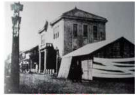
京橋月島警察署庁舎

佃・月島・勝どき・晴海地区を管轄している警察署は月島警察署です。警察に行くことは免許証更新時ぐらいでしたが、防災訓練などでお世話になった警察担当者の方から「ぜひ移転した月島警察署を見学しに来てください」とのお誘いをいただきました。天空新聞で参加者を募集しましたところ、4名の方から申込みがあり、11月2日(日)に見学に行きました。