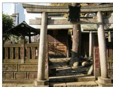
佃波除稲荷神社 Kさん撮影↑ 中央区の文化財「力石」のある波除稲荷神社。佃島の漁業に従事する若い衆などが持ち上げて力比べをした石です。

『うちは商売繁盛祈願で毎年小網神社だね(新川在住)』、『元旦は混むので5日の初水天宮に行きます(月島在住)』など、ご家族によって行き先、目的も異なります。『佃波除稲荷って知ってる？区的重要文化財があるよ(佃在住)』初めて聞きました！隠れスポットですね！