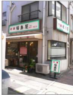
福島屋 03-3551-8539 中央区湊1-3-3

ここ「福島屋」のタンメン・餃子は最高ですよ。場所は銭湯湊湯の先ですから新川ではないですね。老夫婦で切り盛りしている昔ながらの中華屋さんです。ぜひぶん高年齢ですから無理はききません。覚悟していくように。まず注文してから30分ぐらい待たされることもあります。そういう意味ではサラリーマン向きではありませんね。ちよっと覗いてみて「食べないで待っている人」が多そうなら、時間をずらして出直したほうがよいかも!