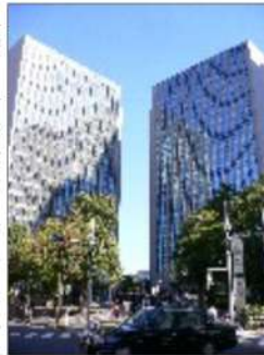
新川住友ツインビル、隣にはダイヤモンドビルも

オフィス街の多い中央区ですが、佃・月島はあまり企業が多くないようです。中央大橋を渡った新川には大きなビジネスビルもあり、ランチ時にはたくさんサラリーマン達が街に出てきます。そんな新川で働く人々は毎日どんなランチを食べているのでしょうか? きっと安くて美味しいお店がたくさんあるはずです。 私たちもちよっと足を延ばして食べに行きたいですね。