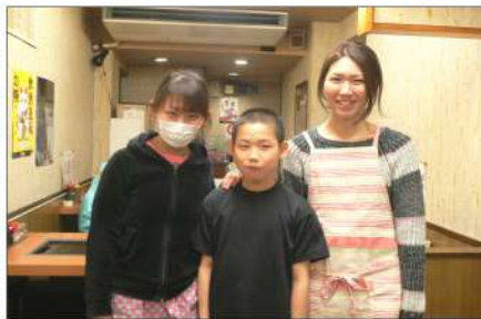
ここに通っちゃう理由の一つ、2代目三姉妹と3代目の若旦那! 笑顔です

「もんじゃ月島」はまだ月島にもんじゃ焼き屋が十軒程度しかなかったところに先代が経営していた勝鬨煎餅店から三姉妹が商売替えしてもんじゃ屋に替わった。塩煎餅と海老煎餅は人気だった。落ち着いて食事をできる雰囲気、いつも家族連れやサラリーマンでにぎわっている。