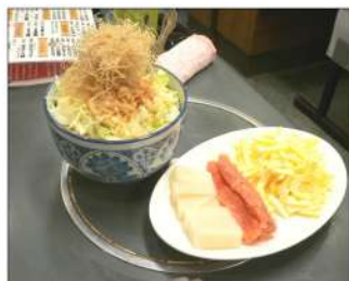
明太子餅チーズもんじゃ ボリュームたっぷりビールにもよく合う! . . . 1,250円

店に入るとずらりと並んだ有名人のサインがまず気になる。下町の名店飲食店にはこの色紙はつきもの。「石川さゆり」ももんじゃ食べるのか、なんて歓談しながら店のお勧め且つ人気メニュー「明太子もちチーズ」と「豚キムチ」、それに「ミックス(豚・イカ・エビ)」の三つのもんじゃを頼んでみる。