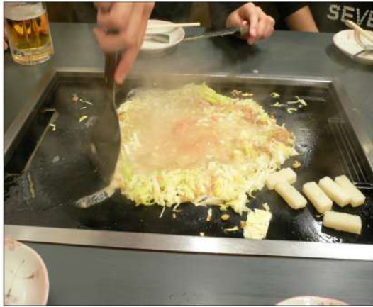
初心者にはおばちゃんが手際良く作ってくれる。具で土手を作るのは関東だけだとか。

月島3丁目の四番街ですから西仲通りの勝どきよりの端です。すぐそばには東京居酒屋名店の「岸田屋」もあります。