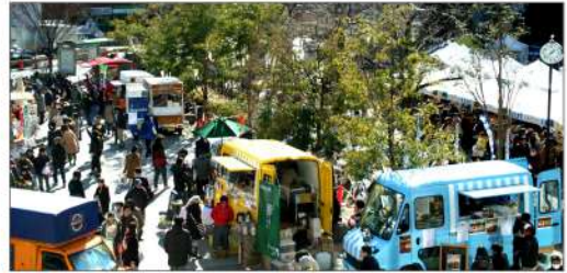
月島第二児童公園

佃・月島などの下町では日常的に市が立っています。門前仲町では毎月一日・十五日・二十八日は縁日ですし、毎年7月に開かれる月島「草市」も伝統ある市です。でもこのマルシェは下町の市とはずいぶん違いますね。