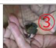
食欲旺盛な子ガエルは、春から夏にかけて公園のバツタ、カマキリ、ミミズなどを食べて、秋には2cm程度に成長します(写真③)。

子ガエルになれば水に入ることはありませんが、雨は好きな様で、雨の日に良見かけます。