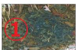
佃公園の住人はアズマヒキガエル、とてもおとなしくて愛嬌のあるカエルです。3月ごろに、数千個の寒天のようなヒモ状の卵を池などに産み、1週間から10日でおたまジャクシが誕生します(写真①)。

ば水面をスイスイと泳ぐ姿を想像しますが、ヒキガエルは、繁殖期以外はほとんど水に入らないカエルです。日本の代表的なヒキガエルは、ニホンヒキガエル、アズマヒキガエル、ミヤコヒキガエル、ナガレヒキガエルの4種類ですが、佃公園の住人はアズマヒキガエル、とてもおとなしくて愛嬌のあるカエルです。3月ごろに、数千個の寒天のようなヒモ状の卵を池などに産み、1週間から10日でおたまジャクシが誕生します(写真①)。