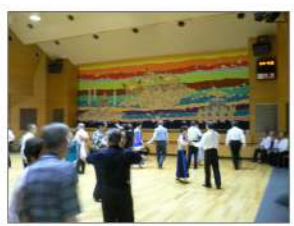
取材の当日、ホールは「ひまわり社交ダンスの会」の皆さんが楽しく活動していました。

天空 どのくらいの料金で借りられるのですか？ 大谷館長 認定された社会教育関係登録団体なら35名66㎡の洋室全日で2,070円です。ホールで平日夜間舞台・客席付きなら10,920円となっています。