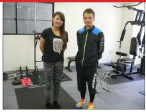
スクールの皆さんご協力頂き有難うございました！簡単に始められる加圧トレーニングの間はまだまだ増えそうです。皆さん是非試してみてください。

今回はビプール月島店で加圧トレーニングをされている34名の方に天空新聞からアンケートをお願いしました。さてその結果は？ 23%が男性 圧倒的に女性が多いと思っていました。ちよつと意外でしたが腹部が気になるとの声が多いようです。 35%が30代以下 50代の方も18%と広い世代の方に加圧は支持されています。 効果はどこに現れましたか？ 体全体がシャープになってきた。体力がついてきた。一部だけの効果ではなく全体に及ぶようです。 効果はどのくらいの期間で感じましたか？ 早い方で1か月、遅い方でも6か月で確実に効果が感じられるそうです。