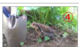
我が家で育つたオたまジャクシは、メダカのエサ、煮干粉、パン粉、粉チーズなどを食べて大きくなりました。佃公園では何を食べているのでしょうか？さて、子ガエルの天敵は何でしょうか？答えは鳥、魚、は虫類です。我が家の池でも鳥がオたまジャクシを狙っていました。これが大量に卵を産む理由です。さて、「ガマの油売り」のガマガエルは、ヒキガエルと言われる力カエルが居たらしく、桜川公園の片隅にある、一観音菩薩・地藏菩薩の脇にガマガエルの石像があったりしますので、お散歩のときに捜してみてください。

大都会の真ん中にも、たくさん生き物が住んでいます。ぜひ、ゆっくりとリバーシティを歩いて自然観察してみてください。伊藤さん宅で育てられたカエルは5月21日(木)夜に佃公園に帰りました。