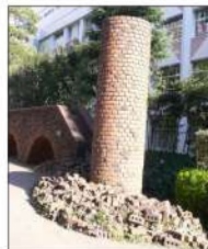
佃小学校横 のレンガ造り。 まさかこの場所がプリズン跡だからではないですね。でもそんなイメージ。