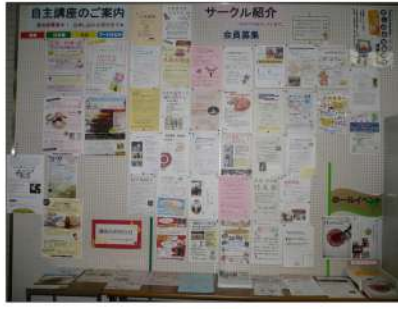
たくさんのサークルが活動しています

天空 どのような方が利用できるのですか？ 大谷館長 まず営利を目的としない「団体」登録が必要となります。社会教育関係登録団体と一般団体に区分されます。一定の条件を満たして中央区の承認を得た社会教育関係登録団体でしたら、料金の支援や早期予約の特典があります。