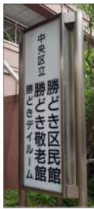
「いきいきき館（敬老館）」

元気で生き生きと老後の人生を過ごせる高齢者を目指して、団塊世代の記者が中央区の高齢者福祉事業を体験してきました。まずは「いきいきき館（敬老館）」