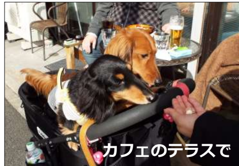
カフェのテラスで