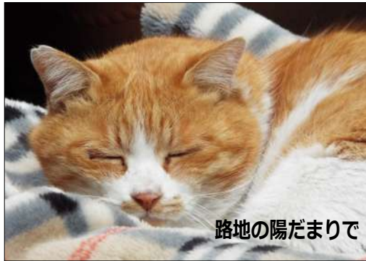
路地の陽だまりで