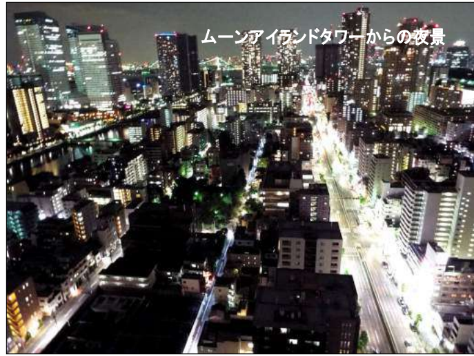
ムーンアイランドタワーからの夜景

そもそも町会・自治会とは？ 町会・自治会はその地に住む住民の方々がよりよい生活を送るためにその地域で暮らす人々と結成された任意の団体です。法律上で規定された団体ではありません。江戸時代の五人組や戦前の隣組に由来する説もあるようです。 中央区役所の地域振興課で伺ったところ佃・月島・新川には27団体があるそうです。 佃一丁目町会など佃は町名ごとに、月島では月島一之部東町会など町名とは別で町会が結成されています。月島独特の町割りがあります。新川は新川二丁目霊一町会や新川二丁目越一町会など旧町名である霊岸島や越前堀が偲ばれます。