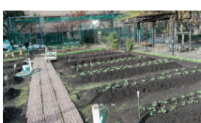
畑のお世話をしていただけ協力者の方もいらっしやるようですが畝もきちんとある本格的な農園です。ゴールデンウイーク明けや運動会後に各学年それぞれに各学年それぞれの願いをもち野菜や花の苗を植えたり種をまいたりしているそうです。この場所は卒業生に確かめたところ、旧月一小のプール跡地であることがわかりました。

早速行ってきました。月島第一児童公園の脇に百坪ぐらいでしょうか?立派な農園がありました。月島第一小学校・幼稚園の学校農園となっています。冬の時期ですから野菜はほとんどありません。