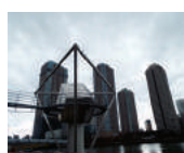
○桐山零のマンションは? 第一話で部屋から見える景色があります。中央大橋は見えず、佃大橋と大川下流が臨めるマンションは新川2丁目(本巻は台町)すばり秀和新川レジデンス6階!!

○川本家の住宅は? 佃小橋を渡って帰るシーンが多く出てくる。ただし木造で二階建て、木塀で小さな庭があるモテルは佃一丁目では見当たりません。