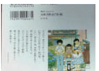
と2部作になっています。主役の桐山零には神木隆之介が。なるほどイメージぴったりです。

映画化「3月のライオン」前編が3月18日土曜日から公開。後編が4月22日土曜日から