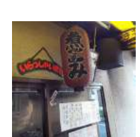
7月の中旬にこの店に取材する手配をいたしました。

でもこの店は雨が降ると車椅子は辛いので中止にします。 「私の店は車椅子OKです」「あの店なら車椅子入れるよ」などの情報をお待ちしています。ご一緒したい方もどうぞ。9月号掲載をお楽しみに！