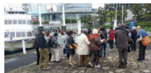
個人でも申し込めます

さあ乗船です。新東京丸は総トン数197トン、全長32mの立派な船です。竹芝ふ頭から右手に日の出ふ頭、芝浦ふ頭を見てレインボーブリッジをくぐります。品川ふ頭、大井ふ頭、羽田沖を中央防波堤先を東京ゲートブリッ