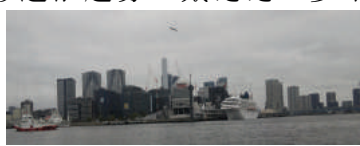
新東京丸は東京港視察船が管理しています

「東京港巡り、楽しかったです。新東京丸に乗せて頂き勉強になりました。ゆったりした椅子、綺麗な船内、埠頭巡りが出来て、リッキー加者からは、楽しかったとの声をたくさん頂戴しました。今回は募集定員を超えた応募があり、ご迷惑をおかけしましたが、2カ月前の16日から先着順で新東京丸ホームページから申し込みます。ただし参加に条件がありますので確認ください。今後とも地域の諸団体と関連を深めていきます。