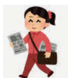
配布には大変な手間と労力がかかります。なるべく多くの住民の方に新聞をお届けしたいのですが、費用や配布要員確保にも限度があります。

一面に配布の方法が変わったことをご報告しました。読者記者の方とポストインクをしていて、何人かの方に声をかけられました。「いつも楽しみに見ていますよ」若い奥様やシニアの方でしたが、大変うれしいことです。ただマンションのセキュリティや管理方針によって投函が禁止されているところもあります。非営利で活動している「佃月島新聞」ですがお届けできないのは残念なことです。