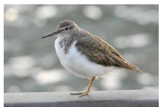
佃月島で観察できる野鳥図鑑 連載⑬

「イソシギ」 シギの仲間、ほとんどが旅鳥で、夏の繁殖地と冬の越冬地の間を行き来して、日本は春と秋に、羽を休めるために滞在しています。ところが、このイソシギはシギの仲間では珍しく留鳥。一年中楽しめるのです。小さくてかわいい鳥なので、ぜひ見つけてみてください。石川島公園の川沿いのフェンスの下などにいることが多いです。