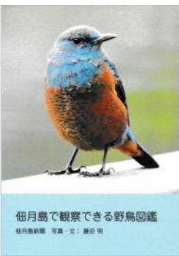
佃月島で観察できる野鳥図鑑 佃月島新聞 写真・文：藤田 明

カモが渡ってくる季節。川辺がまたにぎやかになってきました。ホシハジロのオスは、背中からお腹までが白く、頭が茶色と、色が特徴的なので遠くからでも見分けられます。頭がおむすび形で、ほっぺがふくらんでいるところにもご注目ください。比較的小型で、潜水を得意とするカモです。魚などの水中生物や木の実などを食べています。 コラムを執筆いただいている佃21日の藤田さんは、毎年2月頃開催の「野鳥観察会」の運営メンバー。総編集冊子を制作しました。ご希望の方に原価（200円）で頒布中。ご自宅にお届けします。