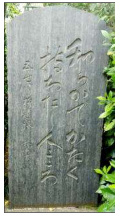
江戸佃島の漁師に養われ、魚問屋を開き名主となり、佃島に尽くしたとされています。

「五世川柳水谷緑亭の句碑があります。和らかで、かたく持ちたし 人ごころ」幼いころ父をなくし、江戸佃島の漁師に養われ、魚問屋を開き名主となり、佃島に尽くしたとされています。