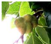
ノシリヌグイやヘクソカズラ、ハキダメギク等もひと

その形が手をグーにした時の拳に似ているからコブシと名付けられたと伝わっています。昔の人はかなり直感的な感性で命名したもので、他にもケンポナシ（その実が茶色く、火傷等で手指が癒着した状態（ケンポ）に見える事からついた）といわれ、今では侮辱罪で訴えられそうな物があります。以前載せたママコ