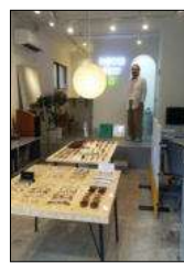
河岸通 西仲通 1-3-7

一面からの続き。この頃、新規にオープンした佃月島オンリーワン店もありました。「メガネのセレクトショップ」月島3