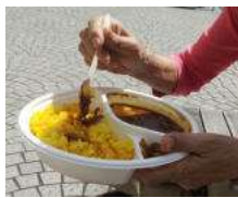
急ぐ私達、しかたなく、カレー弁当で我慢です。

5本のバスを乗り継いで、もう13時は過ぎています。名物伊勢屋の焼き鳥定食をと、井の頭公園口店を目指しました。吉祥寺です。伊勢屋さんの人出で、行列でも行列です。先を急ぐ私達、しかたなく、カレー弁当で我慢です。