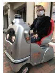
「ZMP佃BASE」でラクロに乗る編集長

近ごろリバーシティ21界隈で、人を乗せてゆつくり走行しているミニカーを見かけますね。グレイと赤のコンビネーションで可愛い目がついています。これは「ラクロ」という一人乗り自動運転ロボットで、二〇二〇年十月より佃・月島エリアでシェアリング(乗り合い)サービスが開始されています。開発企業の株式会社