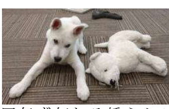
ハクを見てみると育ったなりでいいような気がするが、犬の前歯の矯正か、思案中である。

2代目ハクの話 体重はこの2か月ほど倍になり現在10kg強。正月休みにこの紀州犬を案内してくれた日本犬保存会のお宅に、ハクを連れて行ってここまでの生育状態を見て頂いた。子どものうちには特にお格形成が大切でBDSという粉末の犬用カルシウムをドッグフードの上にかけて、さらに煮干しをちぎって数匹分さらに粉末犬用ミルクを混ぜて与えている。しかし、いろいろな中で1点、まだ小さな前歯の乳歯が上下の噛み合わせが気になるとのこと。もしかしたら、その矯正をすることも出来ない。何も知らずに無邪気に走り回っているハクを見てみると育ったなりでいいような気がするが、犬の前歯の矯正か、思案中である。