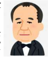
3年(明治6年) 渋沢栄一が「総監

好美の幕末中央区② 日本青年会議所(JC) 中央区委員会会でボイス トレーナーの祖父江好 美さんの連載コラム。 渋沢栄一シリーズ