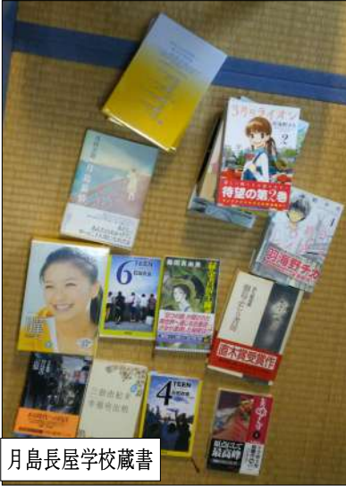
月島長屋学校蔵書