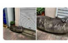
佃二丁目公園の前にあるこの石。よく見ると何か文字が書いてあります。これが何なのか調べることはできますか？？

乗船時に、簡易なライフジャケットを着用し、デッキにも出られるので、開放感抜群の景色を、お友達と