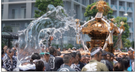
2015年 佃2丁目の読者からの提供でした。ちょうど自宅の前で偶然撮影しました。打ち水が「水神の龍」のように見えます。

佃祭 傑作画像と8K撮影 8月の令和5年住吉大祭は5年ぶりの開催でした。編集部には読者から画像をたくさん提供していただきました。つくつき新聞の画像コレクションの中から以前の大祭も含めて紹介させていただきます。