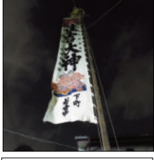
ギシギシと風に泣く音が聞こえてきます。

65号1ページ勝どき御旅所宮神輿の記事、住吉講のメンバーが夜警として徹夜で付き添います。「住吉講」はしません。「月島睦」か? 住吉講の方のご指摘でした。読者校正者求む! 編集部までお待ちしています。