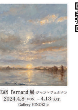
JEAN Fernand展 ジャン・フェルナン 2024.4.8 MON. - 4.13 SAT. Gallery HINOKI e

の作品が第16回フランチナー・ト大賞展最優秀賞を受賞。4月8日、13日、中央区京橋三丁目9-2宝ビル4階ギャラリーE「ジャン・フェルナン展」開催。