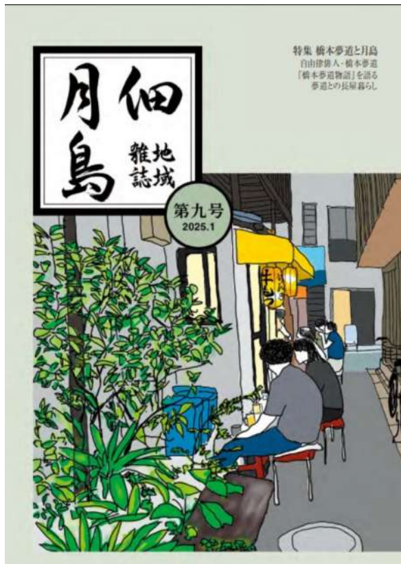
特集 橋本夢道と月島 自由律俳人・橋本夢道 「橋本夢道物語」を語る 夢道との長屋暮らし