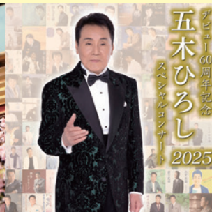
デビュー60周年記念 五木ひろし スペシャルコンサート 2025