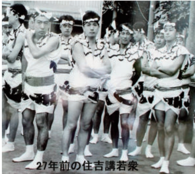
27年前の住吉講若衆

8月4日(金)大旗が掲げられます。宵宮大祭式 祭りの前夜祭、住吉神社で住吉講・連合睦が揃いで勢ぞ