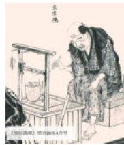
(十六代) 目 櫻木 庵 尾藤 川柳講演(より)

現在のもんじゃ焼きの餛飩粉は薄く、これで文字を書くことは難しいですが、緑亭は佃(たづくり)の号でこんな句を残しています。 杓子筆で八書けぬ文字焼屋