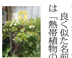
内に取り込む事とありますが、佃二丁目交差点の亀印「うづどん」

良く似た名前、園芸辞典には「熱帯植物のため、冬場は屋内に取り込む事」とありますが、佃二丁目交差点の亀印「うづどん」